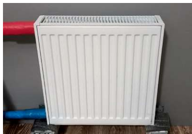
■ Рис. 4. Панельный радиатор тип 22 в испытательной камере

Для расчета стоимости предлагается рассмотреть секционный биметаллический радиатор