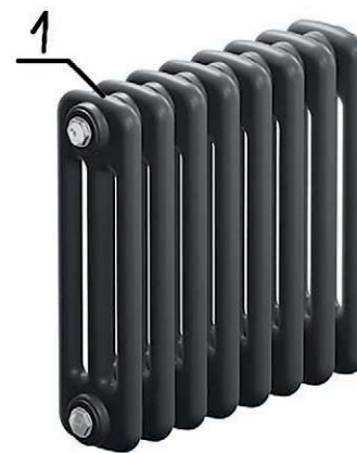
Рис. 3. Трубчатый радиатор

Измерения проводились согласно требованиям к измерительной аппаратуре [п. 5.2, 6] прибором TESTO 905-T2 с погрешностью 1 °С.