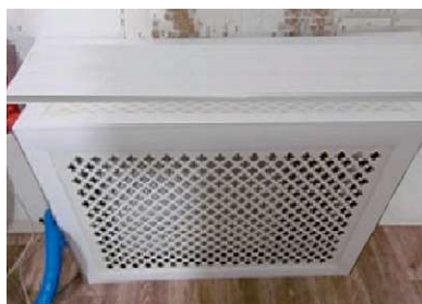
■ Рис. 6. Панельный радиатор в камере с экраном и подоконником