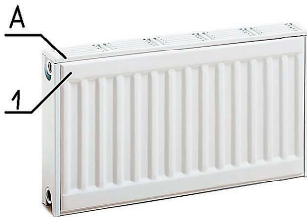
Рис. 2. Стальной панельный радиатор