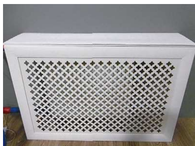
■ Рис. 7. Панельный радиатор в камере с экраном, непрозрачным сверху

(не самый дорогой и не самый дешевый по показателю руб./Вт). Наиболее востребованными на отечественном рынке являются радиаторы восьмисекционные с межосевым расстоянием 500 мм. В той же торговой сети был выбран средний по стоимости биметаллический радиатор. Ниже приведена его стоимость при увеличении секционности радиатора, соответствующей приведенному выше уменьшению теплоотдачи при изменении температурного напора (19 и 35 %):