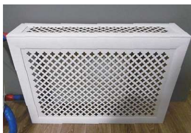
■ Рис. 5. Панельный радиатор с экраном в испытательной камере